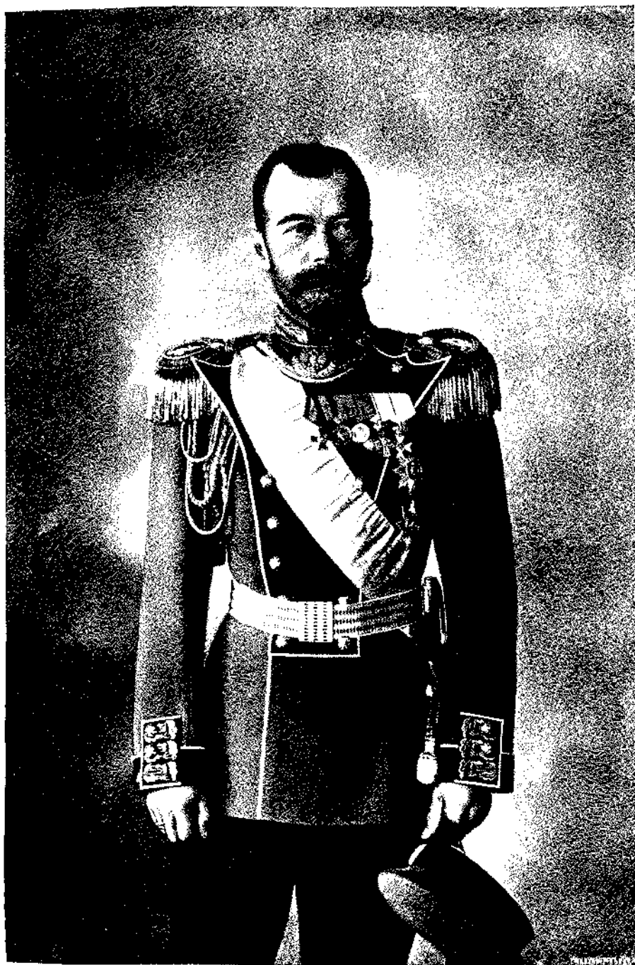
Его Императорское Величество ГОСУДАРЬ ИМПЕРАТОРЪ Николай Александровичъ.